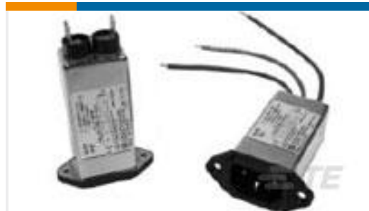
TE 产品编号2-6609006-3 6EJT1=F8135