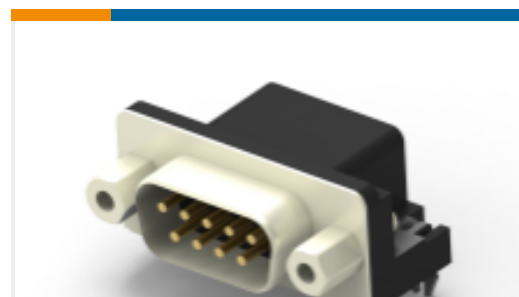
TE 产品编号2301843-2 AMPL PLUG HD20, R/A, 9P, B/L,4-40 S /LOCK