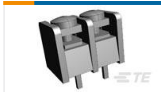
TE 产品编号2-1437667-4 4DB-P108-02=4DB ASSEMBLY