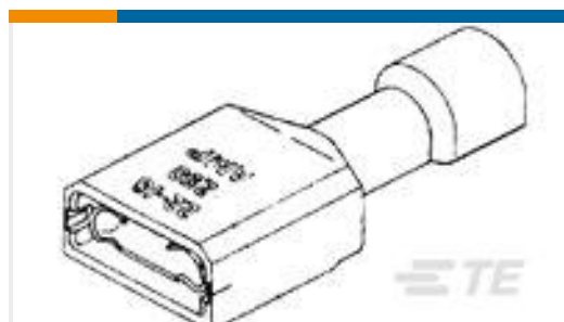
TE 产品编号2-520184-2 ULTRAFast 250 ASSY REC 22-18 TPBR LP