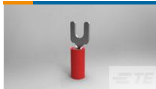
TE 产品编号8-34541-1 PIDG SPD 22-16COMM 22-18MIL 6