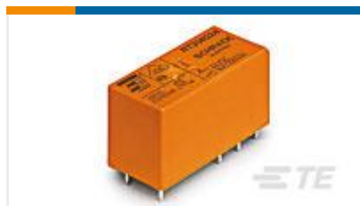
TE 产品编号8-1393239-4 RT314F03