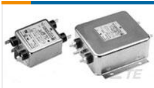
TE 产品编号6609043-3 10VV1=F7252 S0