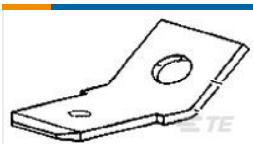
TE 产品编号60465-2 250 FASTON TAB TPBR