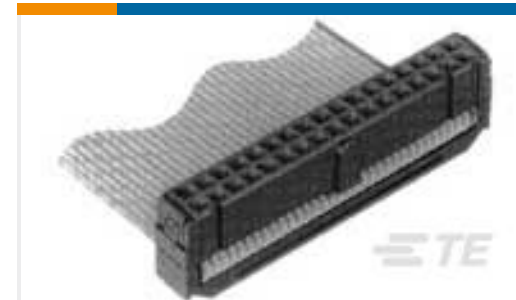
TE 产品编号1658622-6 26 NOVO MIL/CTR 30DP, LEAD FREE