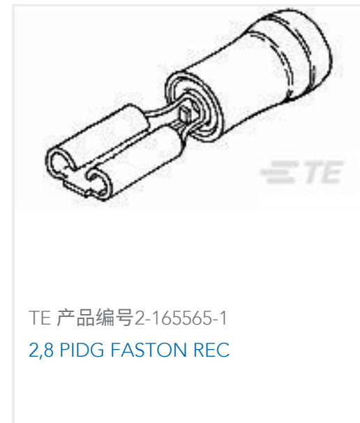
TE 产品编号2-165565-1 2,8 PIDG FASTON REC