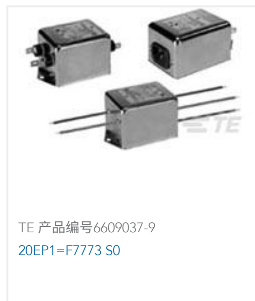
TE 产品编号6609037-9 20EP1=F7773 S0