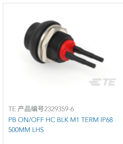
TE 产品编号2329359-6 PB ON/OFF HC BLK M1 TERM IP68 500MM LHS