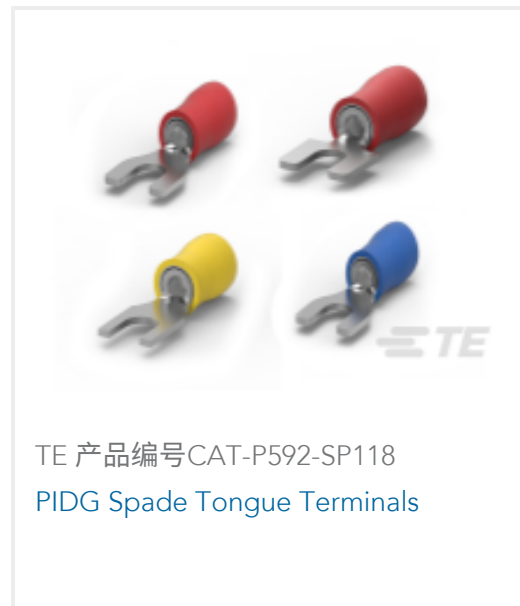
TE 产品编号CAT-P592-SP118 PIDG Spade Tongue Terminals