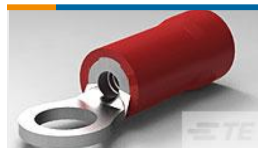
TE 产品编号34142 PG R 22-16 COMM 22-18 MIL 6