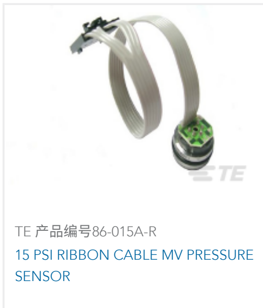
TE 产品编号86-015A-R 15 PSI RIBBON CABLE MV PRESSURE SENSOR