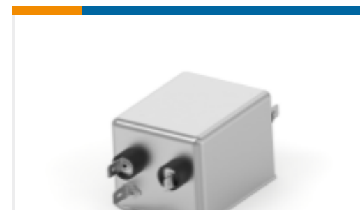
TE 产品编号7-1609089-1 F4381A=10A, 250VAC