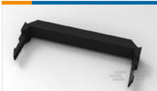
TE 产品编号499252-3 026 STRAIN RELIEF A-L RCPT