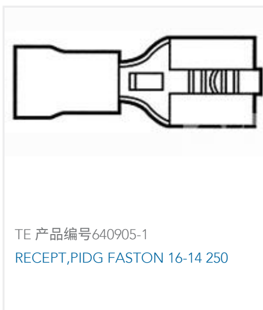
TE 产品编号640905-1 RECEPT,PIDG FASTON 16-14 250