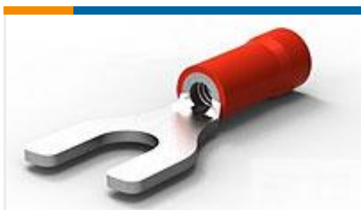
TE 产品编号34155 PG SPD 22-16 COMM 22-18 MIL 8