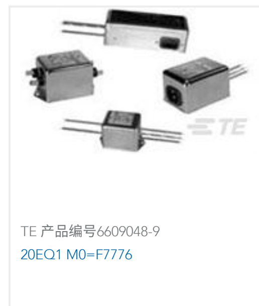
TE 产品编号6609048-9 20EQ1 M0=F7776