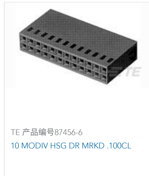
TE 产品编号87456-6 10 MODIV HSG DR MRKD .100CL