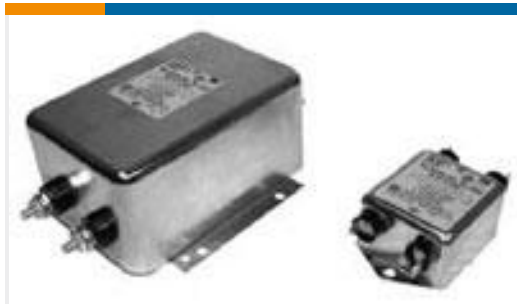
TE 产品编号1-6609037-3 10EMC1=F8128