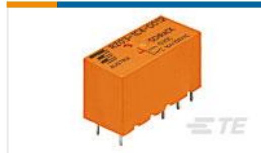
TE 产品编号1-1415899-6 RZ03-1A4-D012