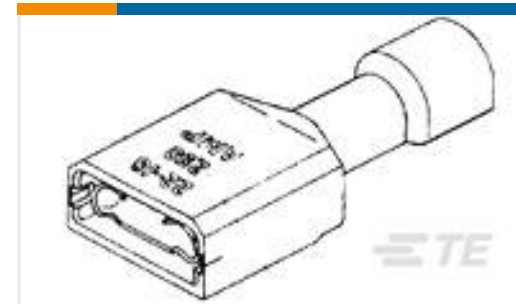
TE 产品编号2-520407-2 ULTRA-FAST 250 ASY REC 22-18 TPBR