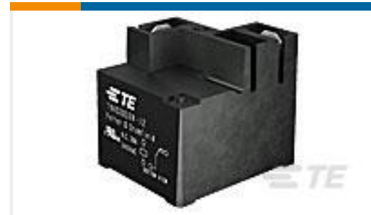
TE 产品编号6-1419102-0 T9AP1D52-12