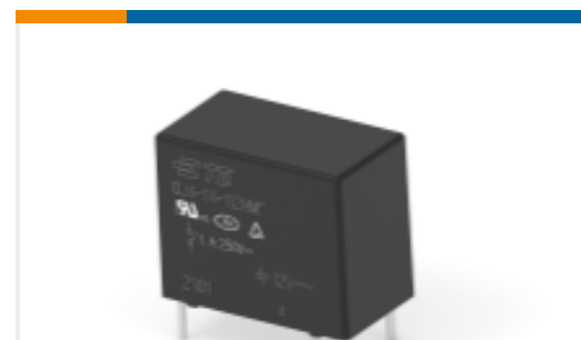
TE 产品编号2071556-4 OJS-SS-112HMF,00000