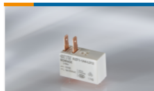
TE 产品编号1833011-4 RZF1-1A4-L012