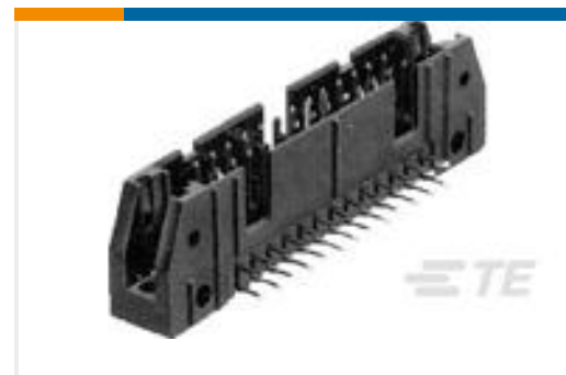
TE 产品编号5102160-1 A/L UNIV HDR 10P RA