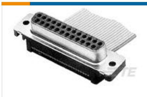
TE 产品编号1658610-1 37 POS HDF RCPT, MS, LEAD FREE