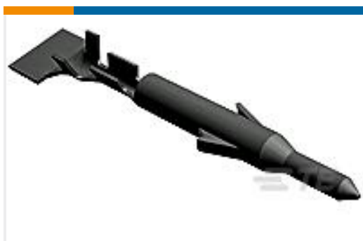
TE 产品编号1-794059-0 MINI UMNL PIN L/P LF