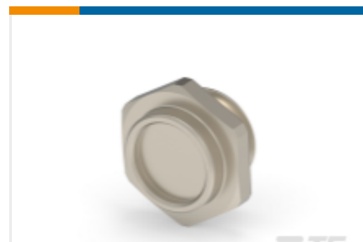
TE 产品编号284067-E M8 METAL SHELL, FEMALE, VERT, 13MM