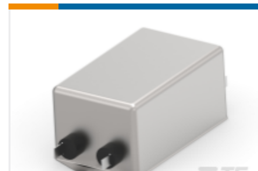
TE 产品编号2-6609037-6 12EP1=F8217