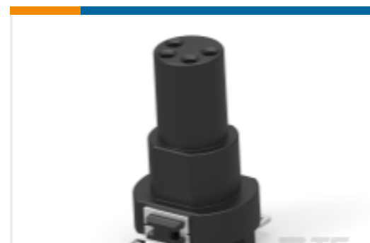
TE 产品编号234234-E M8 FEMALE, A CODE, 4P, 16.25MM SMT