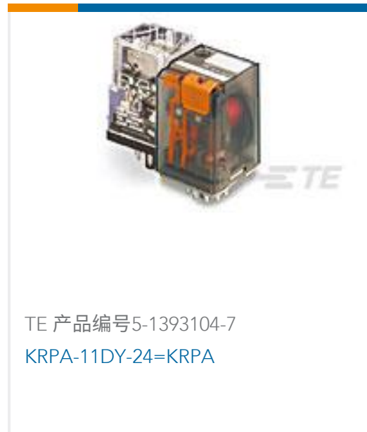
TE 产品编号5-1393104-7 KRPA-11DY-24=KRPA