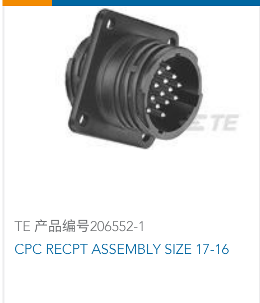
TE 产品编号206552-1 CPC RECPT ASSEMBLY SIZE 17-16