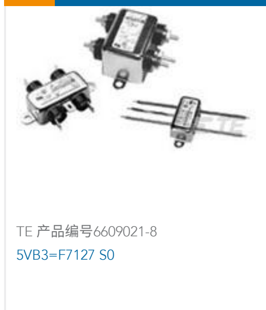
TE 产品编号6609021-8 5VB3=F7127 S0