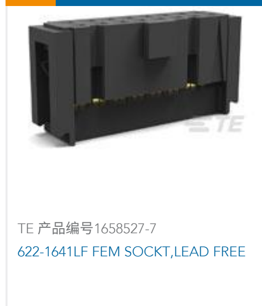
TE 产品编号1658527-7 622-1641LF FEM SOCKET, LEAD FREE