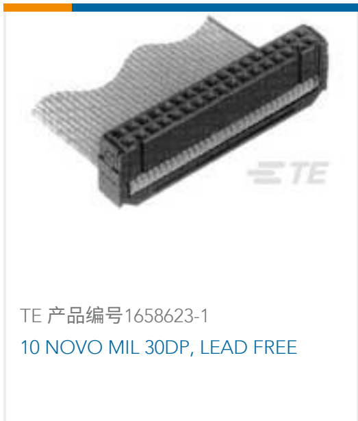
TE 产品编号1658623-1 10 NOVO MIL 30DP, LEAD FREE