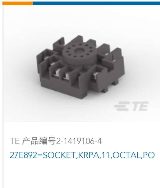
TE 产品编号2-1419106-4 27E892=SOCKET, KRPA, 11, OCTAL, PO