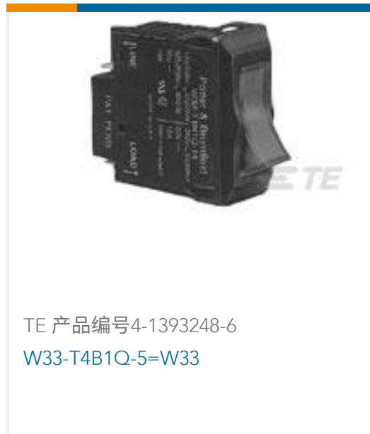
TE 产品编号4-1393248-6 W33-T4B1Q-5=W33