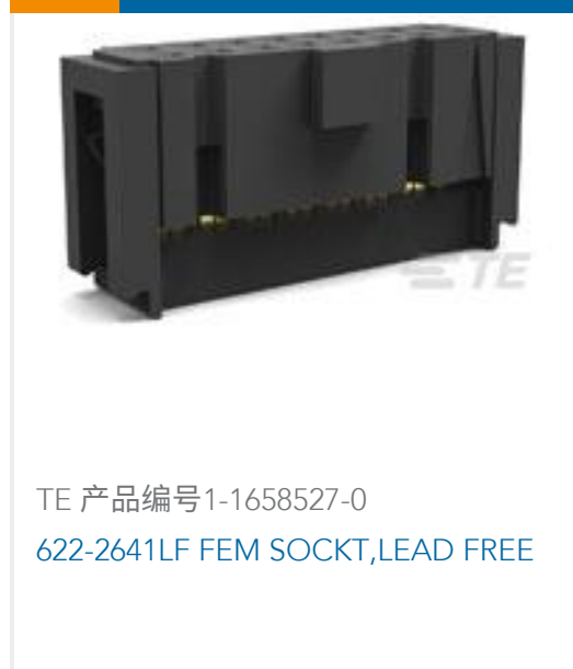
TE 产品编号1-1658527-0 622-2641LF FEM SOCKET, LEAD FREE