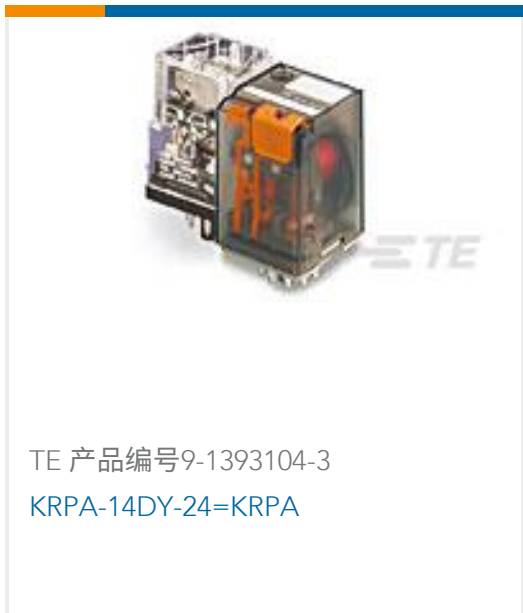
TE 产品编号9-1393104-3 KRPA-14DY-24=KRPA