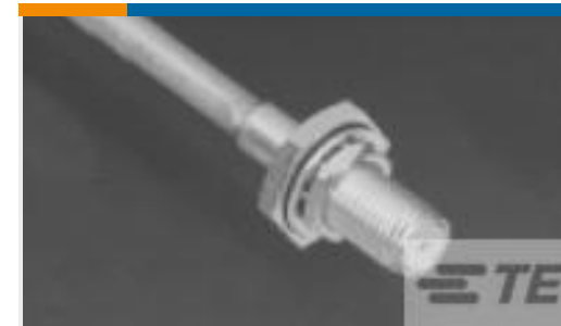
TE 产品编号1051018-1 2004 7985 00