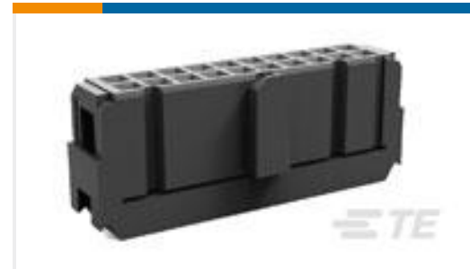
TE 产品编号1658621-8 34 NOVO MIL/CTR 15DP,LEAD FREE