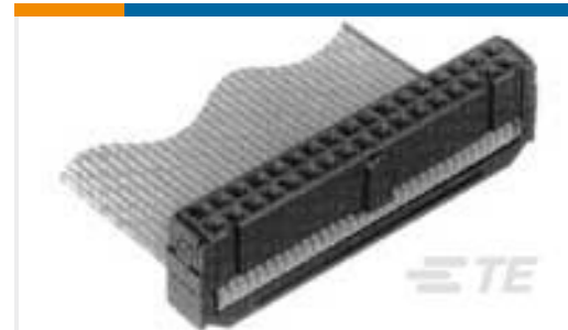
TE 产品编号1-1658622-0 50 NOVO MIL/CTR 30DP,LEAD FREE