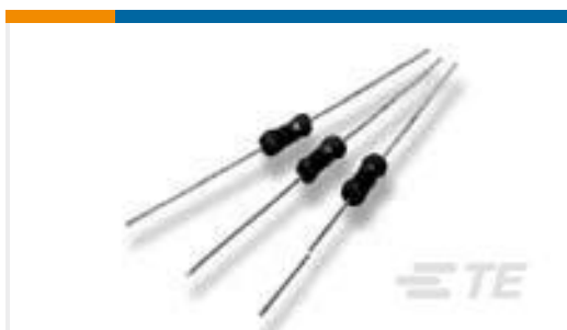
TE 产品编号3-1625890-5 2W SM M/OX 5% 270R