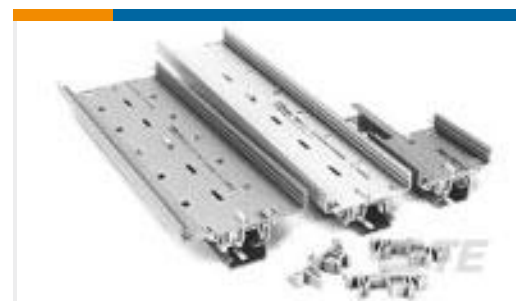
TE 产品编号1-1437685-3 2TK2-48=SNAP TRACK PVC CHANNEL