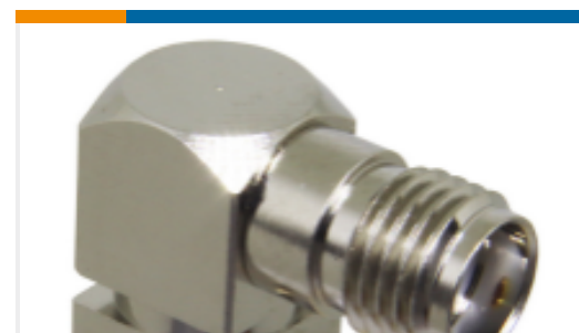
TE 产品编号CONSMA002-SMD SMA Jack 50 Ohm PCB Surface Mount