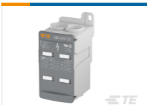
TE 产品编号1SNL850001R0000 DBL500-22