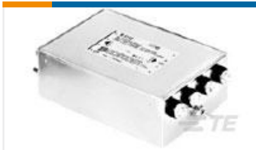
TE 产品编号6609068-8 50AYA6A=F7748A