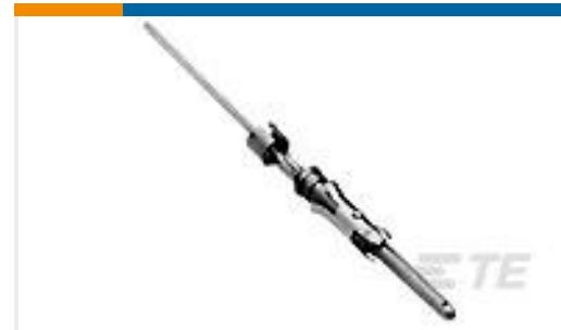
TE 产品编号6-66460-2 PIN,.062 DIA,.025 SQ POST,LP