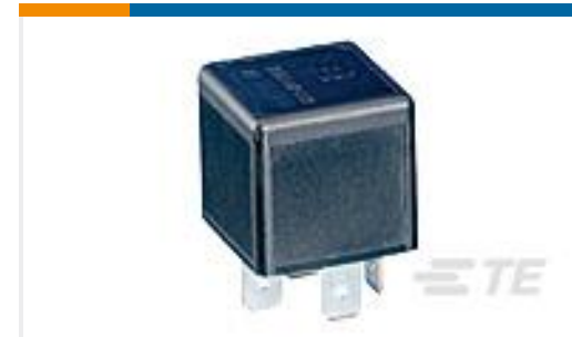
TE 产品编号5-1393304-6 V23134M0052C642-EV-CBOX