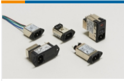
多功能插口式滤波器(13)