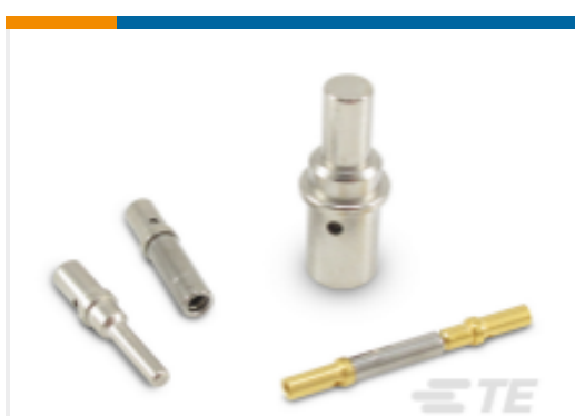
TE 产品编号0460-202-16141 DEUTSCH Solid Contacts