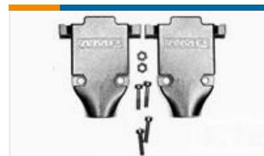
TE 产品编号5745833-9 CABLE CLAMP KIT, SZ 3