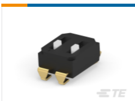
TE 产品编号3-2319847-3 END STACK DIP 2P J RAISED T&R