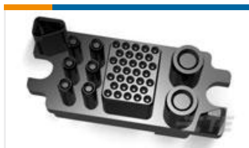
TE 产品编号1648156-1 242-27-01100