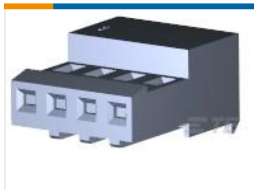
TE 产品编号3-641190-4 04P MTA100 CONN ASSY RED LF