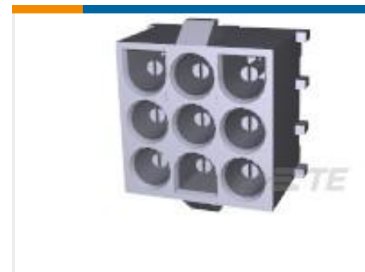
TE 产品编号350586-1 09P UMNL PIN HDR ASSY V2 NATL