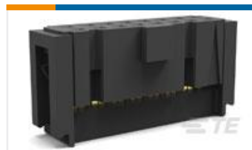
TE 产品编号2-1658527-8 622-3441LF=FSKT IDC S 34 30AU