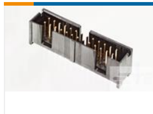
TE 产品编号5103309-6 A/L LOW PRO HDR 26P VERT BLACK