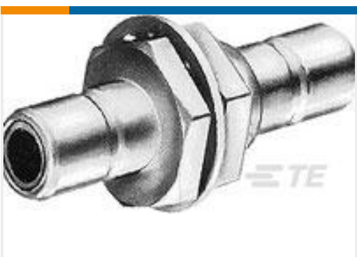
TE 产品编号228553-1 SMB COMML BLKHD ADAPTER