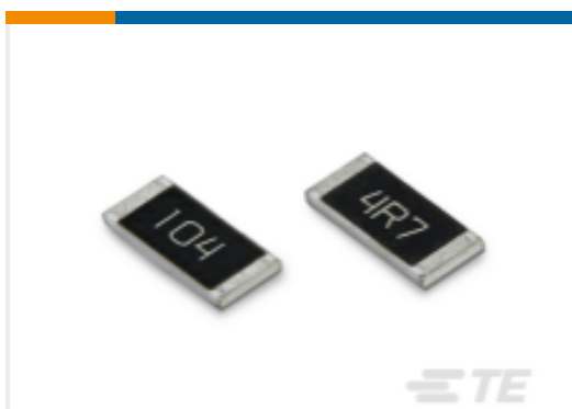
TE 产品编号3-2176456-0 CPF 0603 2R0 0.1% 25ppm 1K RL