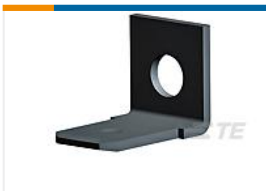
TE 产品编号141879-1 250 FASTON,TAB,BR