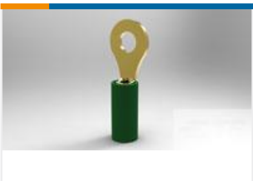
TE 产品编号1-332433-0 TERMINAL,PIDG PTFE R AU 22-20 6