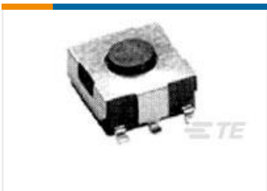
TE 产品编号1-1437565-8 FSM1LPATR=TACT SWITCH 6X6MIL S