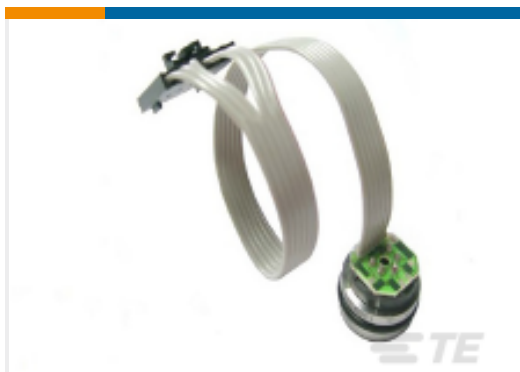
TE 产品编号86-300A-C 300 PSIA CABLE CONN MV PRESSURE SENSOR