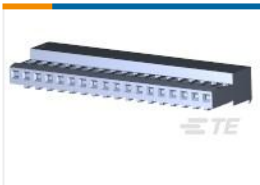
TE 产品编号4-640440-8 18P MTA100 CONN ASSY 22AWG RED