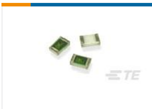
TE 产品编号4-1625867-6 RP 1J 0.166W 18R2 0.1% 25PPM 1K RL