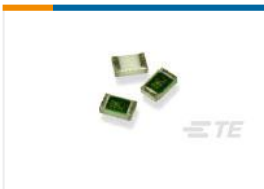
TE 产品编号9-1879061-7 CPF 0402 100K 0.1% 25PPM 5K RL