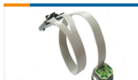
TE 产品编号86-030A-C 30 PSIA CABLE CONN MV PRESSURE SENSOR