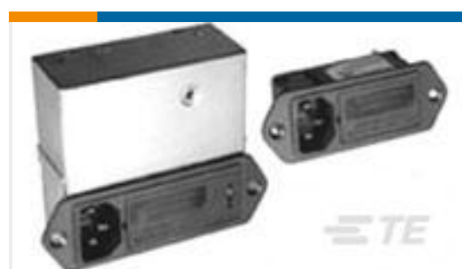
TE 产品编号2-6609129-8 SEFM4S=F8112