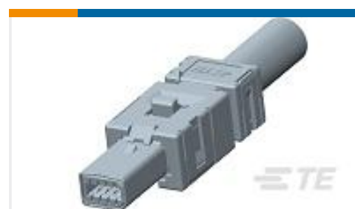
TE 产品编号2201855-1 MINI I/O PLUG KIT TYPE I L