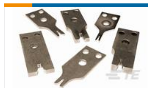
TE 产品编号2-654500-4 CRIMPER WIRE