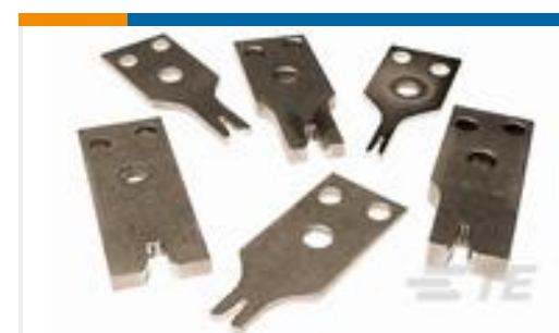
TE 产品编号3-655621-3 ISOLATIONSCRIMPER