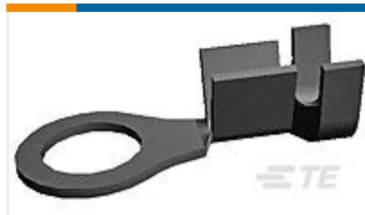
TE 产品编号160337-2 RING TONGUE IS 18-14 0.295 X .940 TPBR