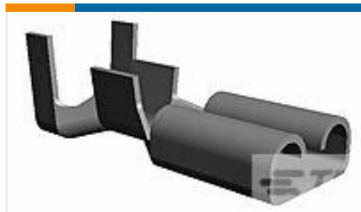
TE 产品编号1217149-1 187 FASTON,REC.,18-14 AWG,TPBR