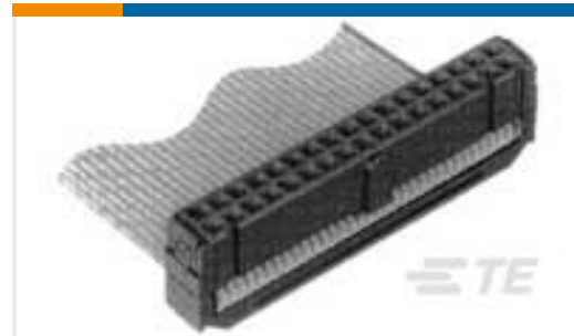
TE 产品编号1658622-6 26 NOVO MIL/CTR 30DP,LEAD FREE