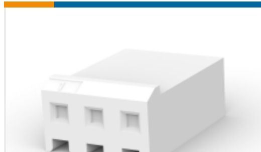
TE 产品编号647402-3 Receptacle Housing: Wire-to-Board, with Mating Alignment, SL156