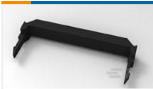
TE 产品编号499252-3 026 STRAIN RELIEF A-L RCPT