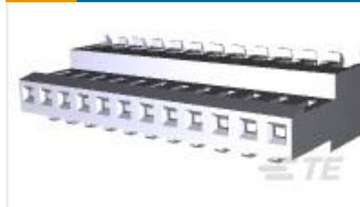
TE 产品编号4-640621-2 12P MTA100 CONN ASSY F/T NATL