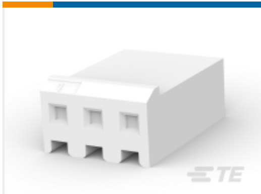
TE 产品编号647402-3 Receptacle Housing: Wire-to-Board, with Mating Alignment, SL156