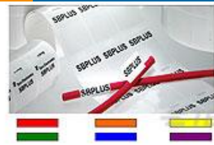
TE 产品编号CN9926-000 SBP100375WE2.5