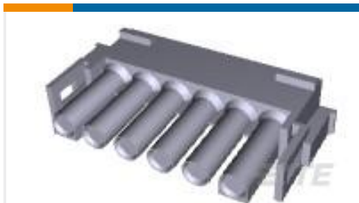
TE 产品编号926300-1 6P UNIV.M-N-L.PLUG