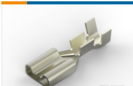
TE 产品编号2238196-3 FASTON 250 STD REC STR 18-14TPBR