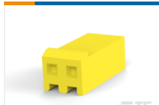
TE 产品编号644267-2 SL156 HSG (YELLOW)