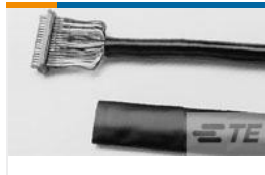
TE 产品编号530219P009 RNF-150-1/4-0-1.25IN