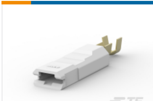
TE 产品编号1969104-1 ULTRA POD：直形，母端组件，无镀层，0.250 英寸