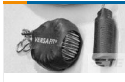
TE 产品编号938365P002 VERSAFIT-1/8-0-0.75IN-ST