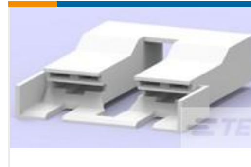
TE 产品编号1-521253-3 PL MKIII & FASTON 250 HSG 2P NYLON GREEN