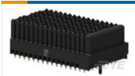
TE 产品编号2102737-1 BP, Right End, MULTIGIG RT 2R