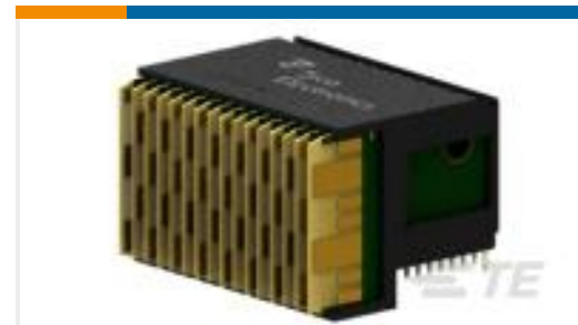
TE 产品编号1410187-3 MULTIGIG RT T2 7RW DC DF CT