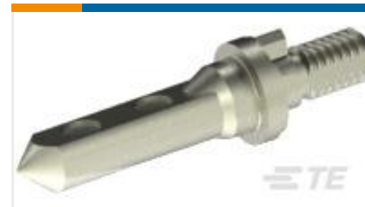
TE 产品编号1-1469491-2 MULTIGIG RT GUIDE PIN, 9MM 2.60