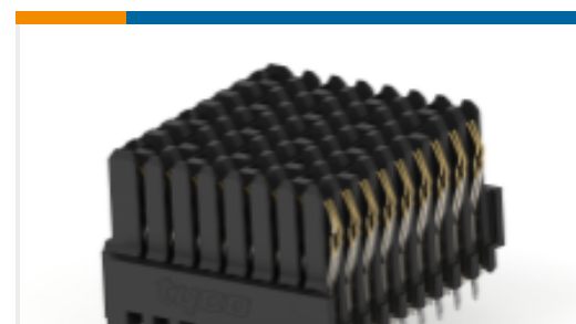
TE 产品编号2332817-2 Vert RCPT Left End Half Multigig RT 3