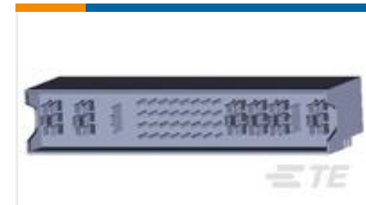
TE 产品编号6450849-7 MBXLE R/A HED 2ACP+1LP+32S+3HDP+1LP+1P