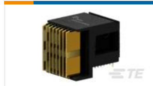
TE 产品编号1410189-3 MULTIGIG RT T2 7RW H-LFT,ET2