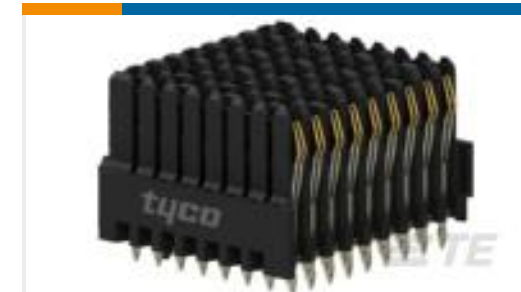
TE 产品编号1410186-1 MULTIGIG RT T2 .8" BP H-LFT