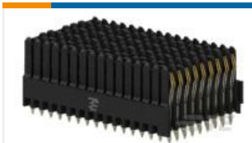
TE 产品编号1410140-1 MULTIGIG RT T2 .8" BP FULL CNT