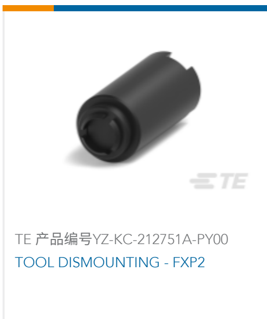
TE 产品编号YZ-KC-212751A-PY00 TOOL DISMOUNTING - FXP2