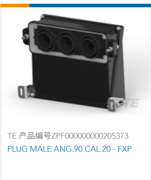
TE 产品编号ZPF000000000205373 PLUG MALE ANG.90 CAL.20 - FXP