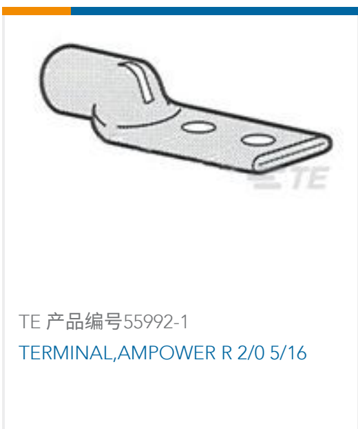
TE 产品编号55992-1 TERMINAL, AMPPOWER R 2/0 5/16