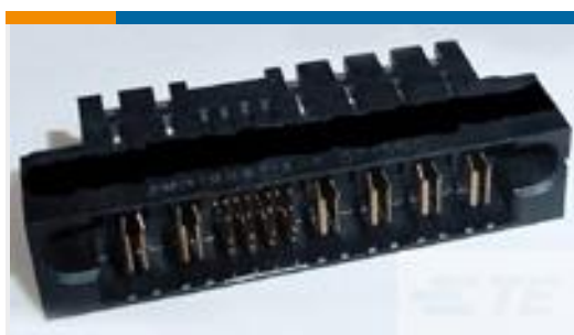
TE 产品编号 1-6450121-9 MBXL R/A HDR 60S+8P