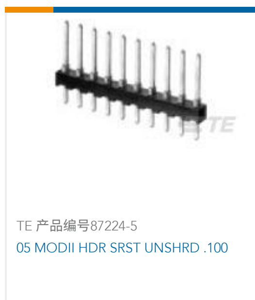
TE 产品编号87224-5 05 MODII HDR SRST UNSHRD .100