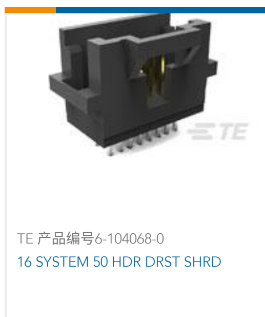
TE 产品编号6-104068-0 16 SYSTEM 50 HDR DRST SHRD