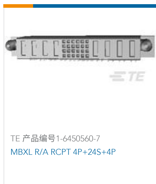
TE 产品编号1-6450560-7 MBXL R/A RCPT 4P+24S+4P