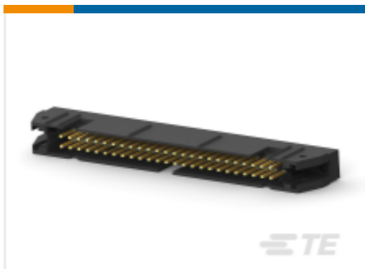
TE 产品编号5102321-4 AMP 锁门通用插头