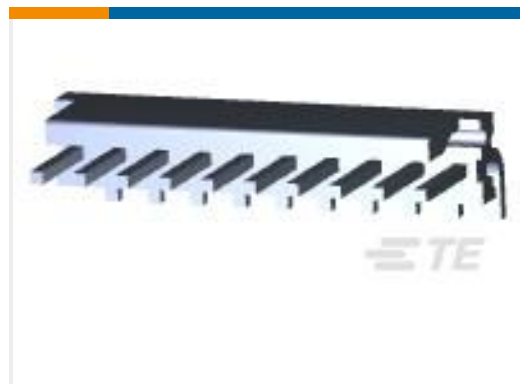
TE 产品编号1-640389-0 10P MTA156 HDR ASSY SQ R/A F/L