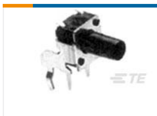
TE 产品编号1571300-2 TACT,RTANG,SMT,SEALED,GUID PIN