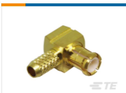
TE 产品编号CONMCX012 MCX Plug 50 Ohm Cable Crimp