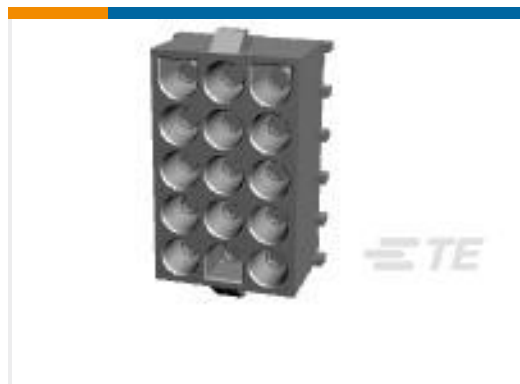
TE 产品编号350765-5 15P UMNL HDR ASSY PC LF