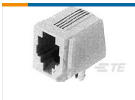
TE 产品编号5520252-4 MJ,R/A,8P/8C,PNL STOPS,KEYED