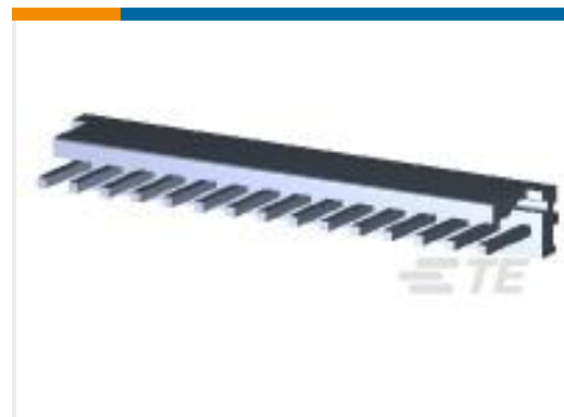
TE 产品编号1-640445-5 15P MTA156 HDR ASSY FL/STR SNL