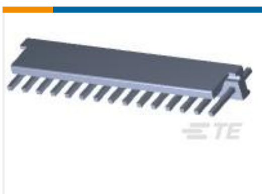
TE 产品编号1-644752-5 15P MTA156 HDR ASSY SQ STR F/L