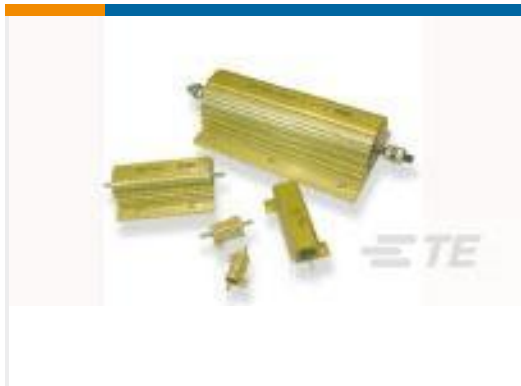
TE 产品编号1-1630019-4 HSC200 2K4 5%