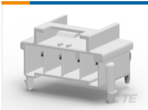
TE 产品编号1-1969694-4 PTL 1X4 PCB HEADER R/A HITEMP KEY A LGR