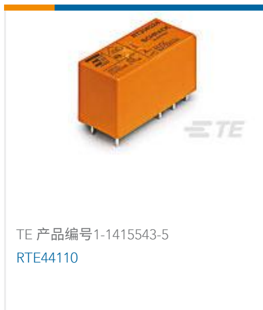
TE 产品编号1-1415543-5 RTE44110