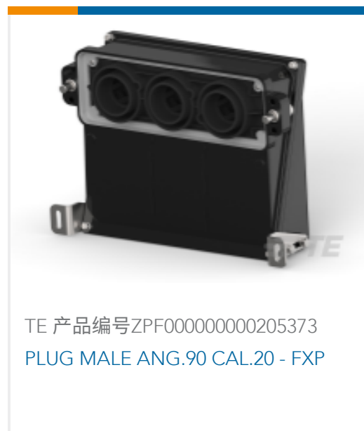
TE 产品编号ZPF000000000205373 PLUG MALE ANG.90 CAL.20 - FXP