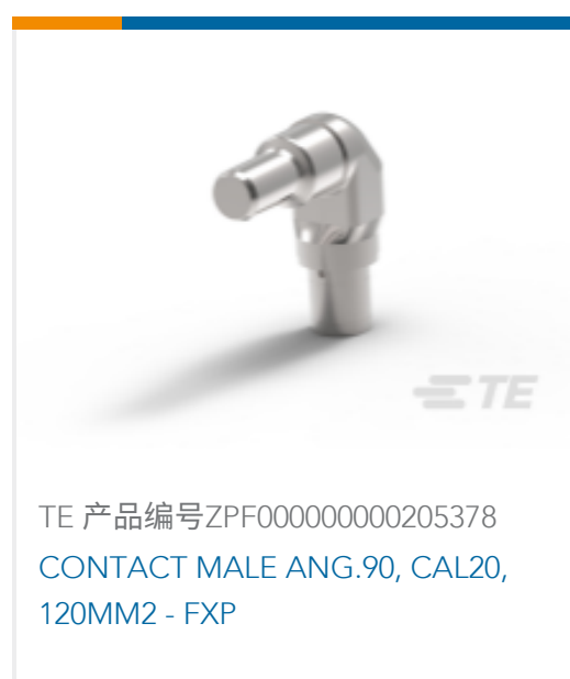
TE 产品编号ZPF000000000205378 CONTACT MALE ANG.90, CAL20, 120MM2 - FXP