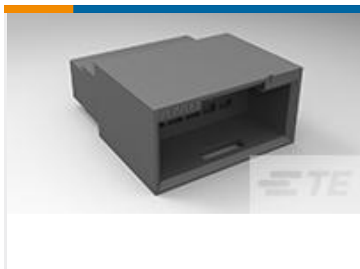
TE 产品编号1-88189-0 026 HOUSING FFC PIN DR 100CL