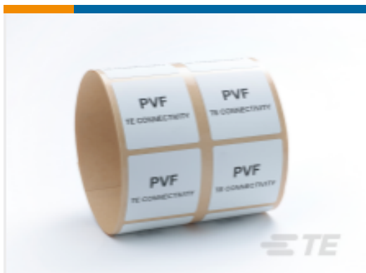
TE 产品编号A03632-000 Polyvinyl Fluoride Labels, White