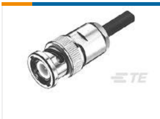
TE 产品编号221265-1 PLUG,CATEGORY A,SERIES BNC