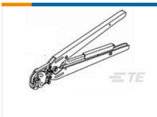
TE 产品编号934677-1 DAHT 250 FASTON TAB 20-14 ASSY