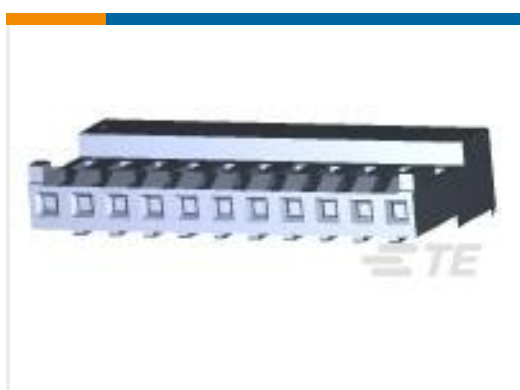
TE 产品编号4-644460-1 11P MTA156 CONN ASSY 18AWG ORA