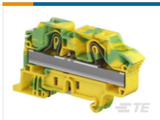
TE 产品编号1SNK712150R0000 ZK16-PE