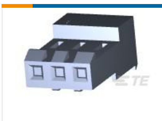
TE 产品编号3-641220-3 03P MTA156 CONN ASSY 24AWG LF