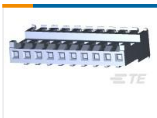
TE 产品编号4-644467-0 10P MTA156 CONN ASSY 22AWG LF