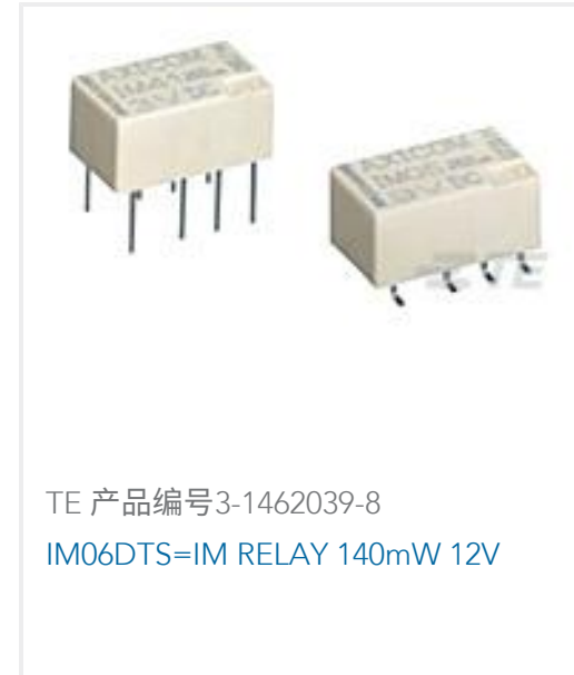
TE 产品编号3-1462039-8 IM06DTS=IM RELAY 140mW 12V