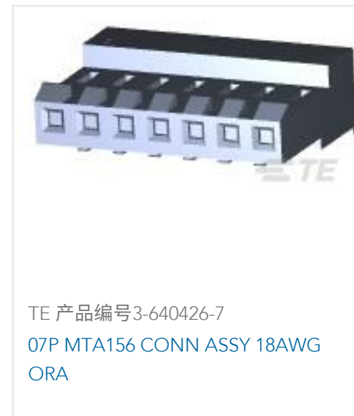
TE 产品编号3-640426-7 07P MTA156 CONN ASSY 18AWG ORA