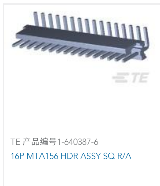
TE 产品编号1-640387-6 16P MTA156 HDR ASSY SQ R/A