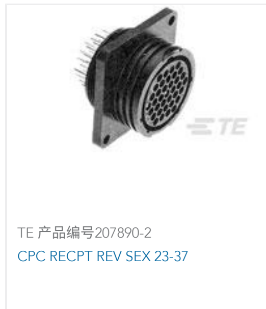
TE 产品编号207890-2 CPC RECPT REV SEX 23-37