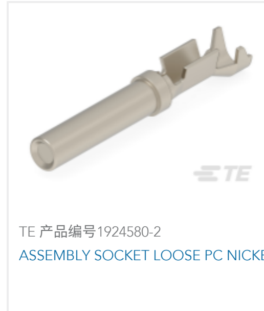
TE 产品编号1924580-2 ASSEMBLY SOCKET LOOSE PC NICKE