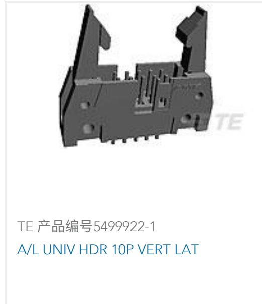
TE 产品编号5499922-1 A/L UNIV HDR 10P VERT LAT