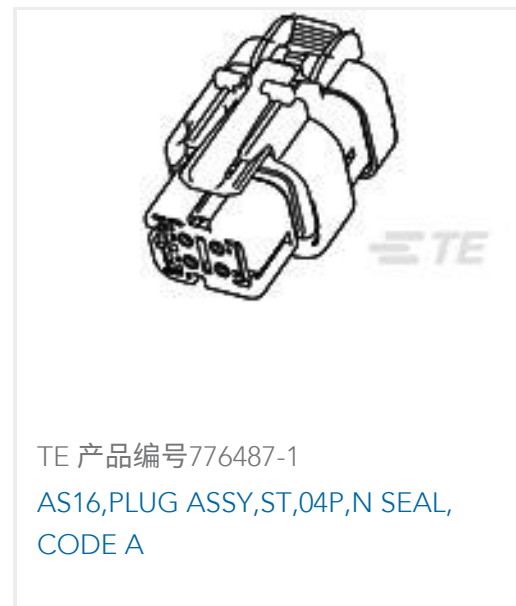
TE 产品编号776487-1 AS16,PLUG ASSY,ST,04P,N SEAL, CODE A