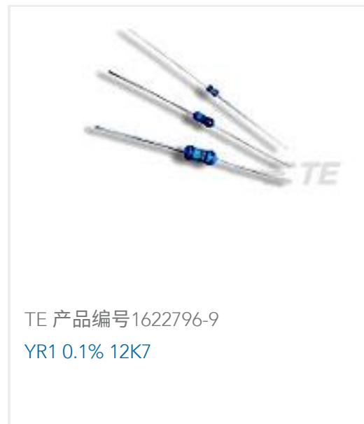
TE 产品编号1622796-9 YR1 0.1% 12K7