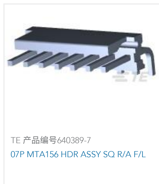
TE 产品编号640389-7 07P MTA156 HDR ASSY SQ R/A F/L