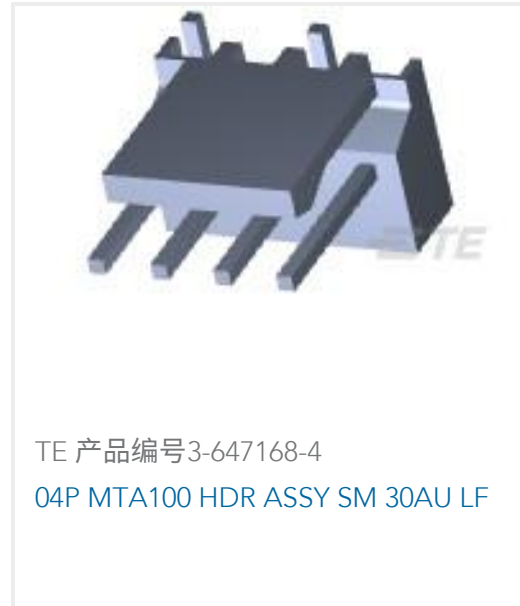
TE 产品编号3-647168-4 04P MTA100 HDR ASSY SM 30AU LF