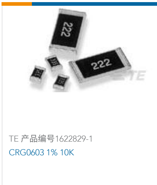
TE 产品编号1622829-1 CRG0603 1% 10K