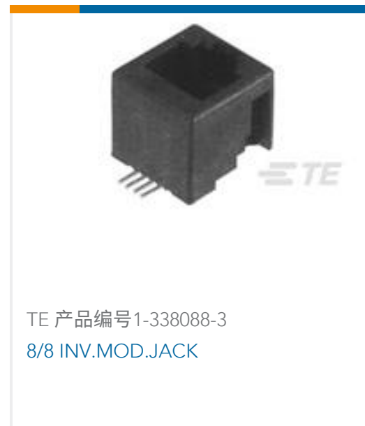
TE 产品编号1-338088-3 8/8 INV.MOD.JACK