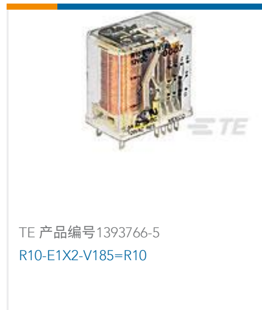
TE 产品编号1393766-5 R10-E1X2-V185=R10