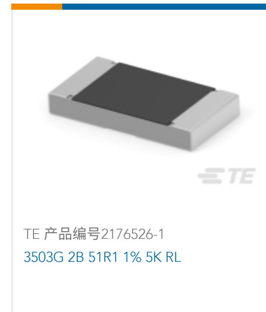
TE 产品编号2176526-1 3503G 2B 51R1 1% 5K RL