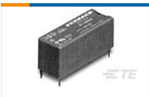
TE 产品编号4-1393224-9 RY211024