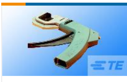
TE 产品编号58246-1 MTA 100 CRIMP HEAD REPAIR DISCRETE