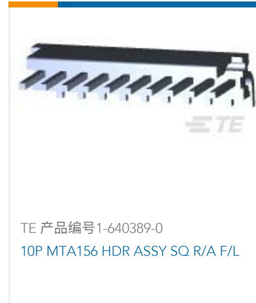
TE 产品编号1-640389-0 10P MTA156 HDR ASSY SQ R/A F/L