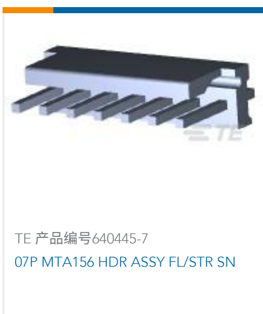
TE 产品编号640445-7 07P MTA156 HDR ASSY FL/STR SN