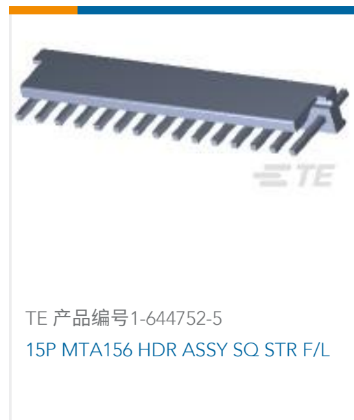
TE 产品编号1-644752-5 15P MTA156 HDR ASSY SQ STR F/L