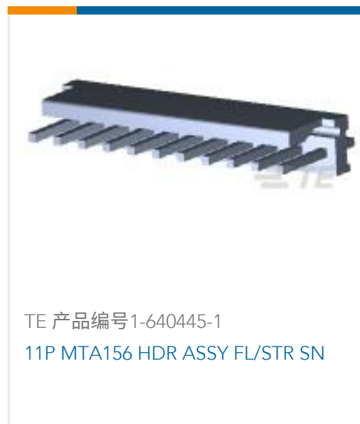
TE 产品编号1-640445-1 11P MTA156 HDR ASSY FL/STR SN