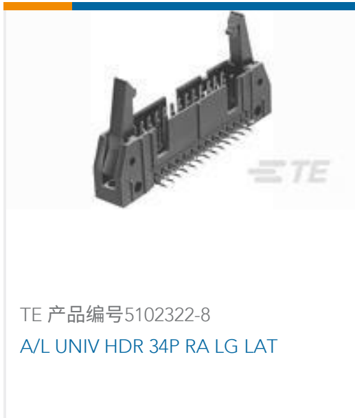
TE 产品编号5102322-8 A/L UNIV HDR 34P RA LG LAT