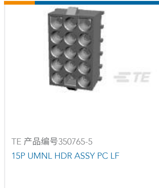
TE 产品编号350765-5 15P UMNL HDR ASSY PC LF