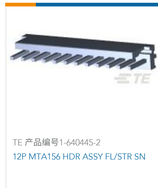
TE 产品编号1-640445-2 12P MTA156 HDR ASSY FL/STR SN