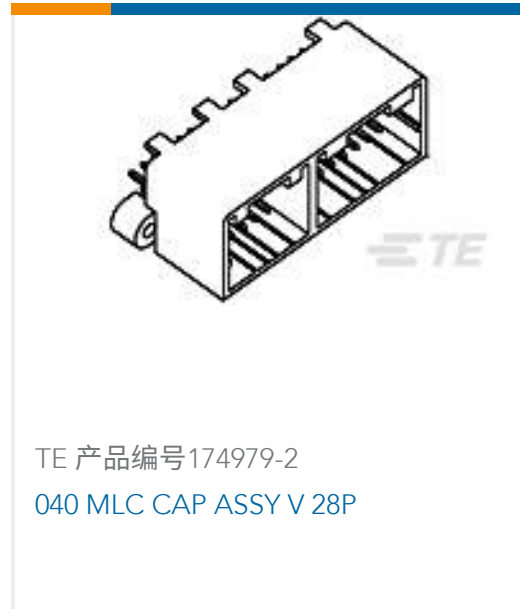
TE 产品编号174979-2 040 MLC CAP ASSY V 28P