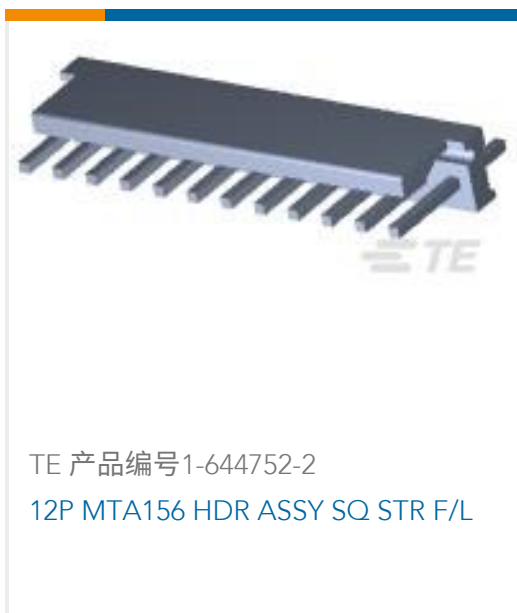
TE 产品编号1-644752-2 12P MTA156 HDR ASSY SQ STR F/L