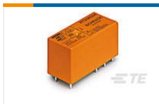
TE 产品编号7-1393243-8 RT424615