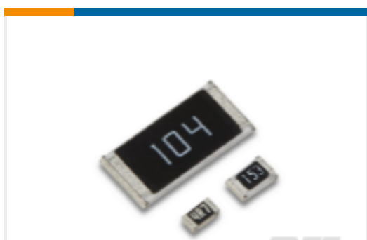
TE 产品编号1-2176343-4 CRGCO 1206 120R 1%