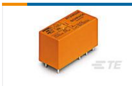
TE 产品编号4-1419136-3 RT423012