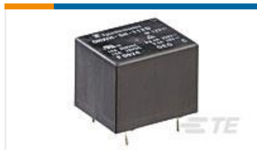
TE 产品编号1-1721150-3 ORWH-SH-112D1F,000