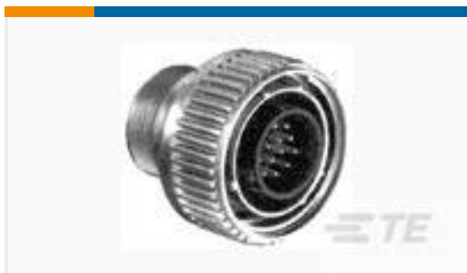
TE 产品编号208472-1 CMC PLUG ASSEMBLY,SZ 28