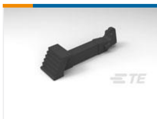
TE 产品编号111451-3 LATCH, UNIV I/O