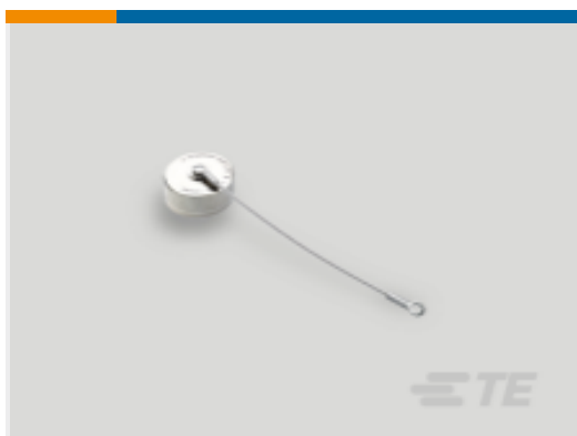
TE 产品编号YDTS33W13RV0010000 DUST COVER ASSEM