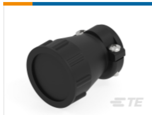
TE 产品编号1-206070-1 CABLE CLAMP KIT #17