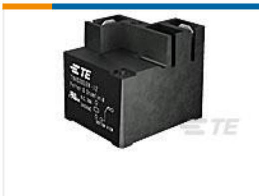
TE 产品编号5-1419102-4 T9AP5D52-12