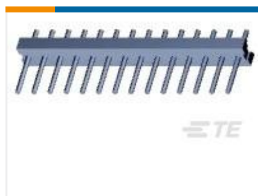
TE 产品编号1-640384-4 14P MTA156 HDR ASSY STR RND SN