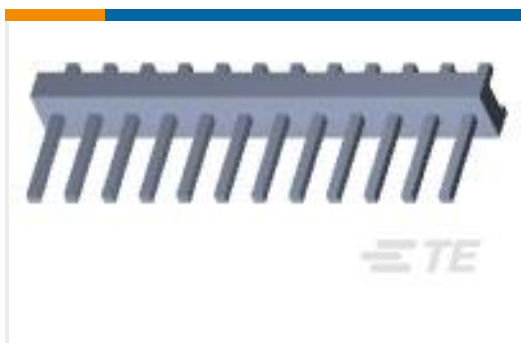
TE 产品编号1-640383-2 12P MTA156 HDR ASSY STR SQ SN