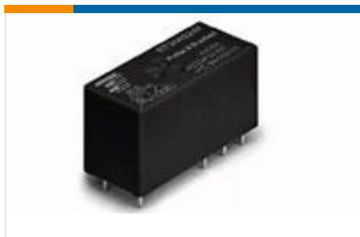
TE 产品编号3-1393237-3 RTE24024F