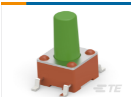
TE 产品编号2-1977223-4 FSM8JSMASSTR=6MM TACT SWITCH, SMT 160gf,