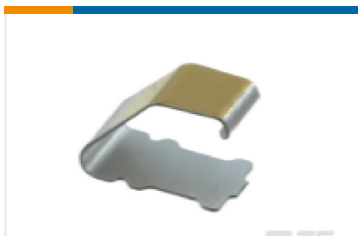
TE 产品编号1734300-1 SHIELD FINGER 3025-Z1-T