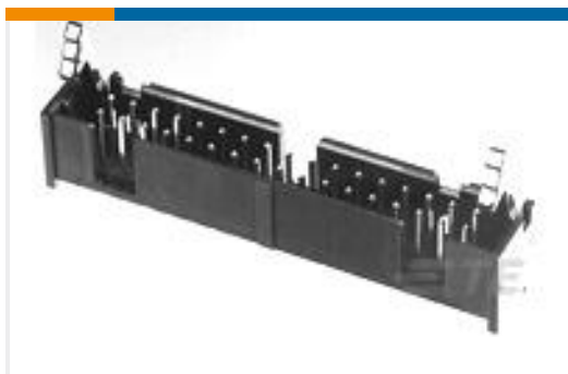
TE 产品编号2-1761606-6 IDC LOW PRO HDR 16P VERT LG LAT BLUE