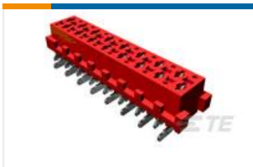
TE 产品编号8-188275-6 MICRO-MATCH SMD FTE