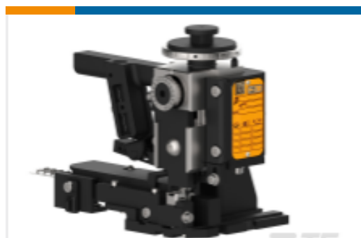
TE 产品编号2837428-1 OCEAN_2.0_Applicator-S-062F071O-RSM