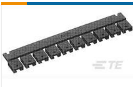
TE 产品编号531230-4 SHUNT,.200 C/L, 2 POS, SN