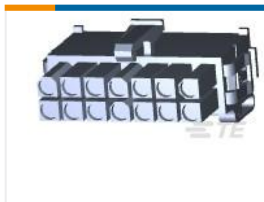
TE 产品编号794202-1 14P MINI UMNL2 PLUG HSG UL94V0