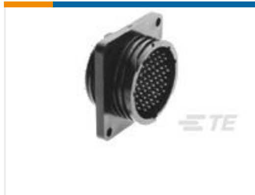
TE 产品编号1-207216-6 CPC RECEPT ASSEMBLY SIZE 17-28