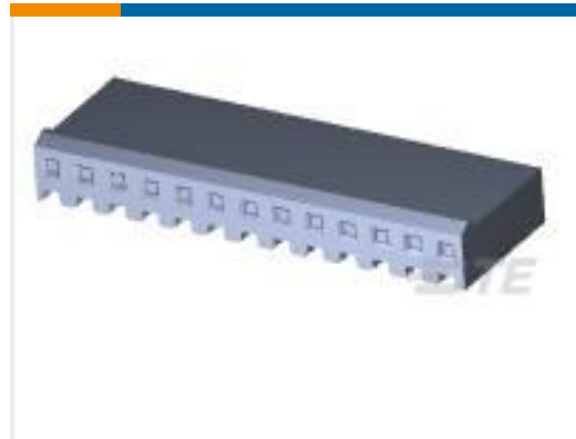
TE 产品编号1-640250-3 13P SL156 HSG W/LCK RAMP NATL