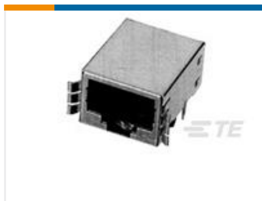
TE 产品编号1116062-2 MJ,10MM,8P,BEZEL PNL TABS,SN