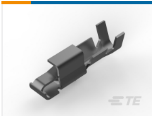
TE 产品编号3-770522-1 Connector Contacts: Wire-to-Board Socket, SL 156