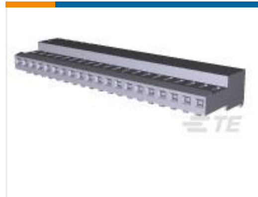
TE 产品编号5-640441-0 20P MTA100 CONN ASSY WHT