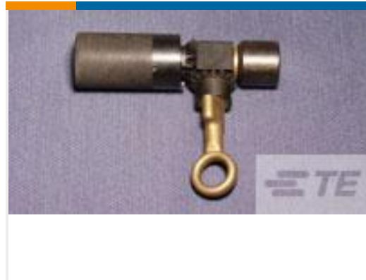
TE 产品编号306347-1 AMPACT GEARED BREACH CAP ASSY