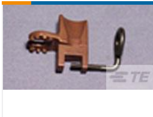
TE 产品编号69900 C & WEDGE HOLDER ASSY