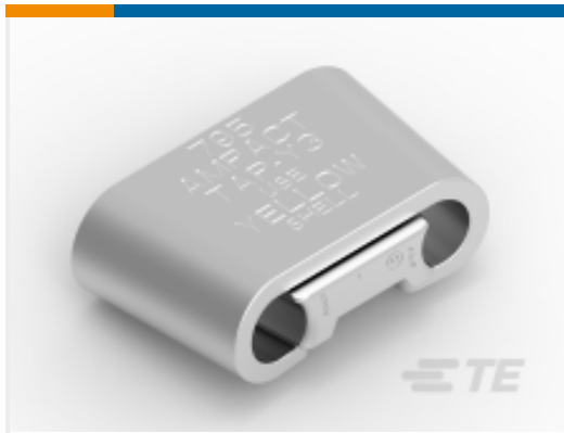
TE 产品编号1443455-1 AMPACT HTT 795.0-795.0