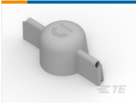
TE 产品编号C85326-000 BCAC-G-ARR-HOT-01(B12)