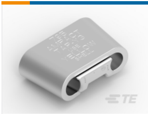
TE 产品编号1443455-3 AMPACT HTT 795.0-636.0