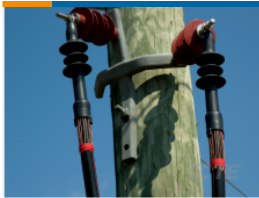
TE 产品编号830433-000 TFT-154E-SG