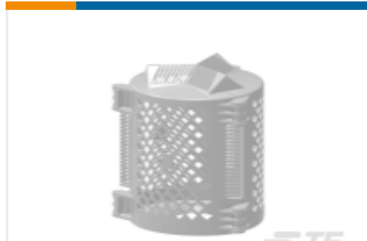
TE 产品编号337774-000 BCAC-G-IC-5D/6(B6)