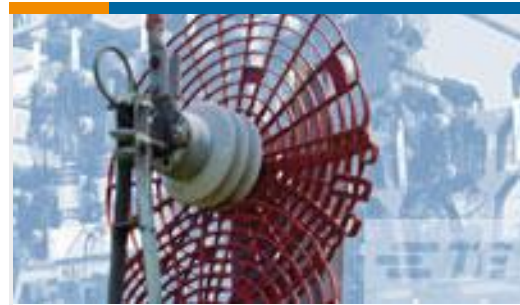
TE 产品编号CR8834-000 BISG-G-24-01(B10)