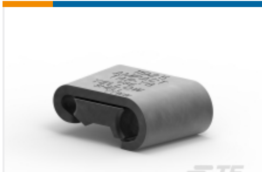
TE 产品编号602121-4 AMPACT 楔形压力分接连接器