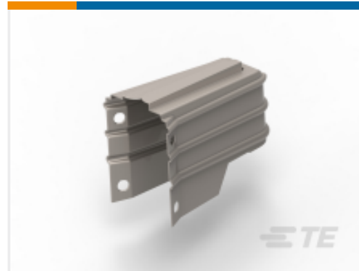
TE 产品编号F36901-000 BCAC-G-CUTOUT-100-01-B12