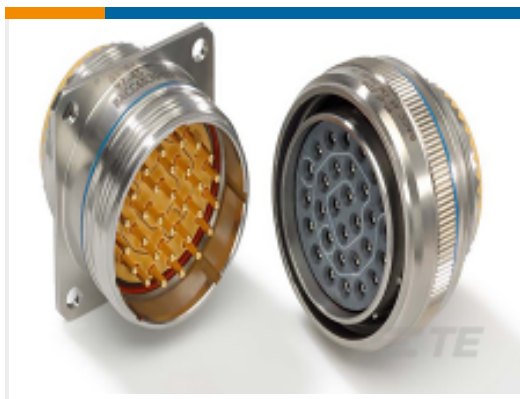
TE 产品编号ZPF200000000008816 983-6SE 12-12 SN-L