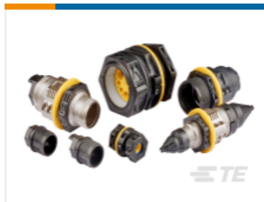
TE 产品编号ZPF000000000097665 D-EASY 03 B