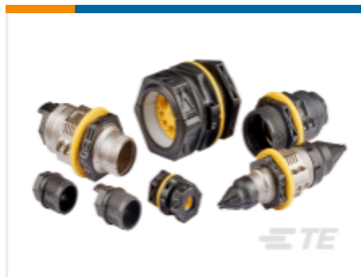
TE 产品编号ZPF000000000097664 D-EASY 03 A