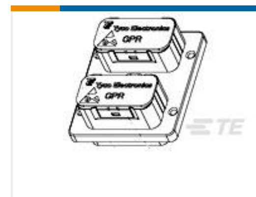
TE 产品编号1877720-1 Rcpt Shell Kit, Vert, Rear Pnl Mt, A-F Jack