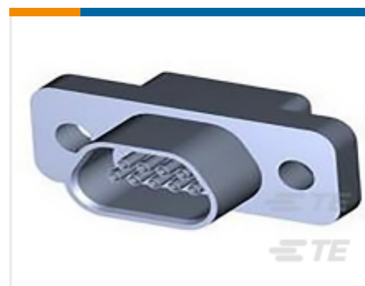
TE 产品编号1532181-6 M83513/03-C10N, MCKS-N1-B-21P6Q1-36.0