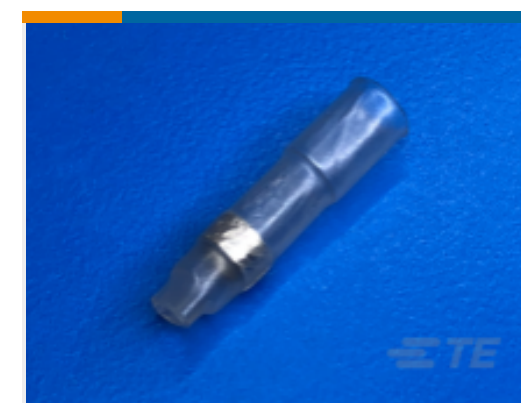
TE 产品编号F78598-000 B-155-1504