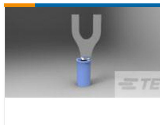
TE 产品编号9-1377173-9 SMP 0-0130537-0