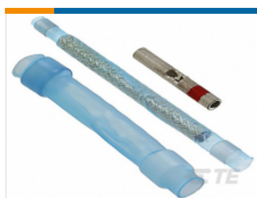
TE 产品编号CW7954-000 D-200-0247-RT-CS4049