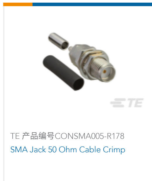
TE 产品编号CONSMA005-R178 SMA Jack 50 Ohm Cable Crimp