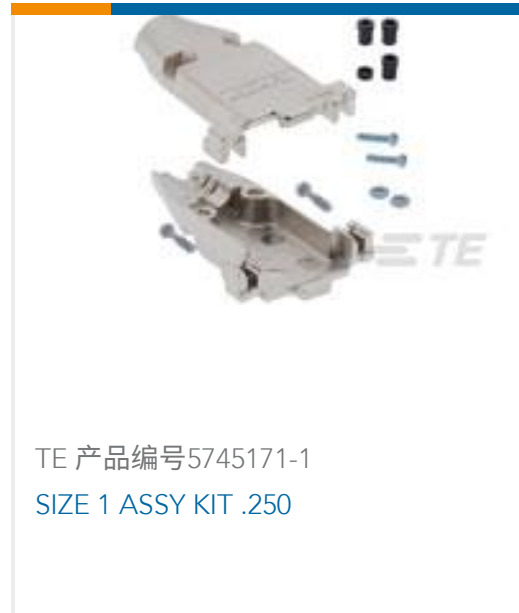
TE 产品编号5745171-1 SIZE 1 ASSY KIT .250