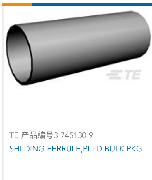
TE 产品编号3-745130-9 SHLDING FERRULE, PLTD, BULK PKG