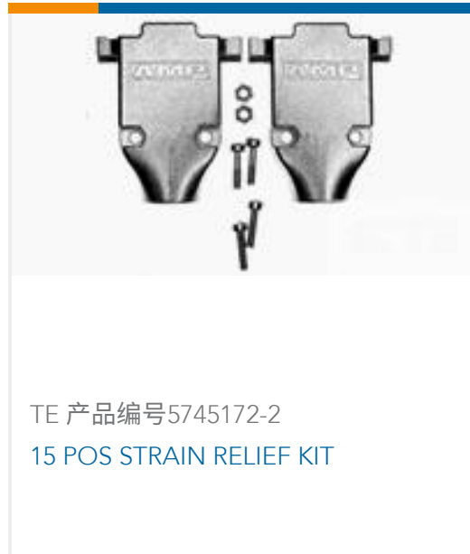
TE 产品编号5745172-2 15 POS STRAIN RELIEF KIT