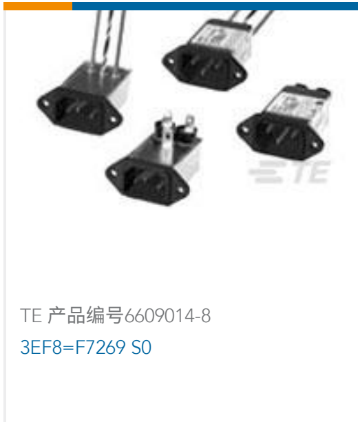
TE 产品编号6609014-8 3EF8-F7269 S0