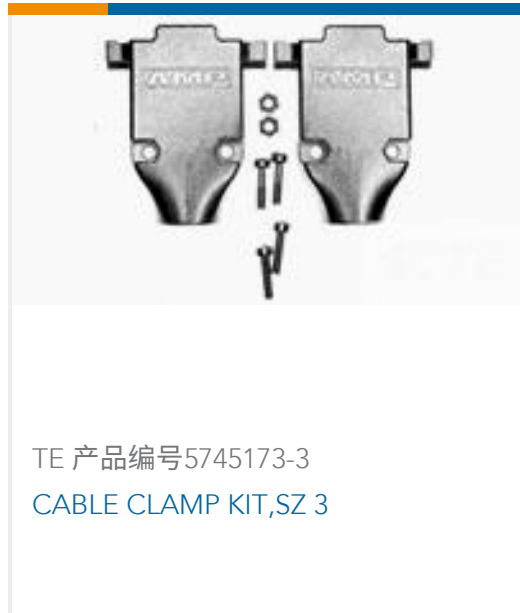
TE 产品编号5745173-3 CABLE CLAMP KIT, SZ 3