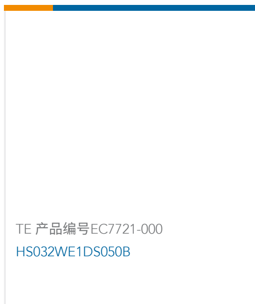
TE 产品编号EC7721-000 HS032WE1DS050B