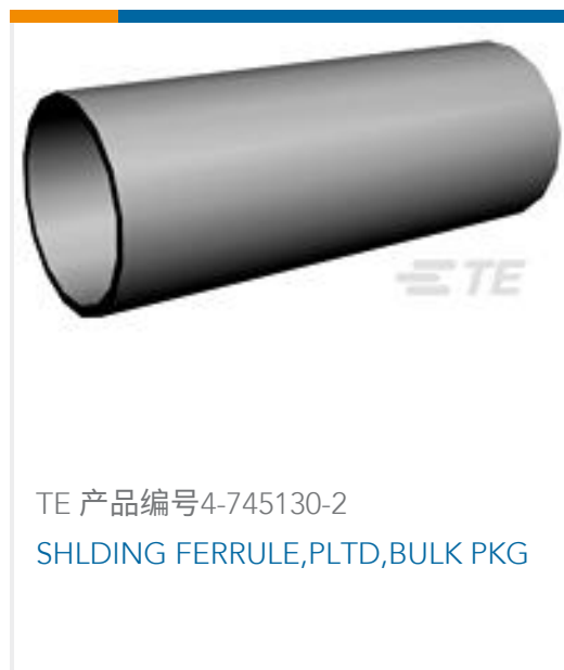
TE 产品编号4-745130-2 SHLDING FERRULE, PLTD, BULK PKG