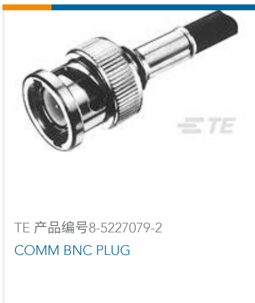
TE 产品编号8-5227079-2 COMM BNC PLUG