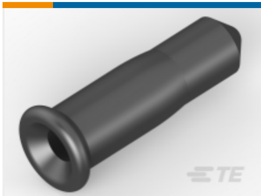
TE 产品编号 1-5645955-2 SOCKET,MIN-SPR B-N SN-AU SER-2