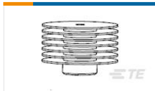
TE 产品编号7-1542006-8 HTS804-U=29MM HS ASSY ULTEM CL