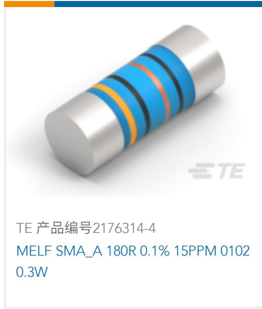
TE 产品编号2176314-4 MELF SMA_A 180R 0.1% 15PPM 0102 0.3W