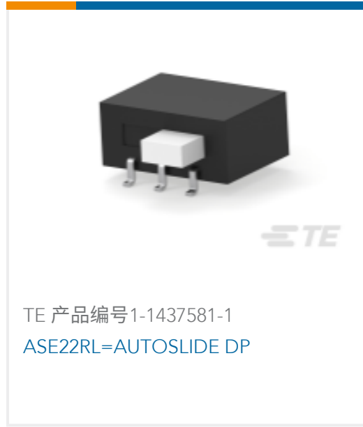
TE 产品编号1-1437581-1 ASE22RL=AUTOSLIDE DP 0.3W