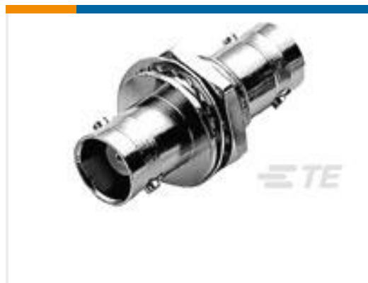
TE 产品编号5228226-1 BNC BLKHD JACK ADAPTER GOLD