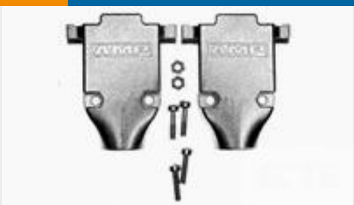
TE 产品编号5748677-5 PLTD PLST CBL CLMP KIT,SZ 5