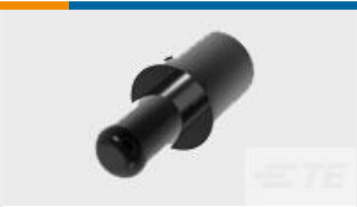
TE 产品编号1766811-1 CONTACT,PIN,#0