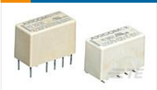
TE 产品编号3-1393788-3 V23079B1201B301