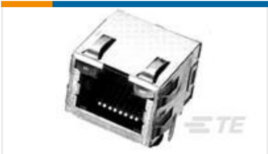
TE 产品编号2-406549-4 IMJ,1X1,PNL GRD,LED(Y/G), S