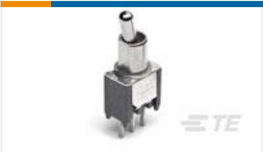
TE 产品编号1825222-3 TT13D2T04