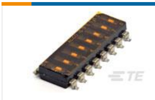
TE 产品编号1-1825006-9 GDS10S04=DIP SW,SLIDE,SMT