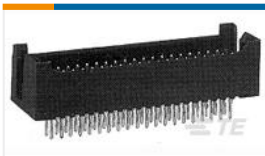
TE 产品编号 1-534978-2 110 MODII 2PC HDR DR W/HLDWN