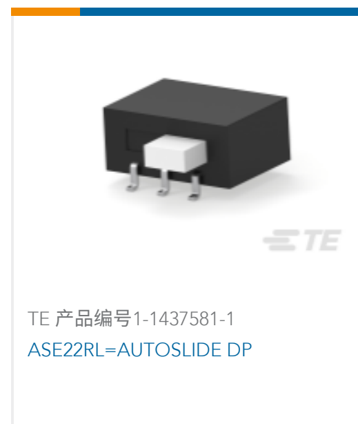
TE 产品编号1-1437581-1 ASE22RL=AUTOSLIDE DP 0.3W