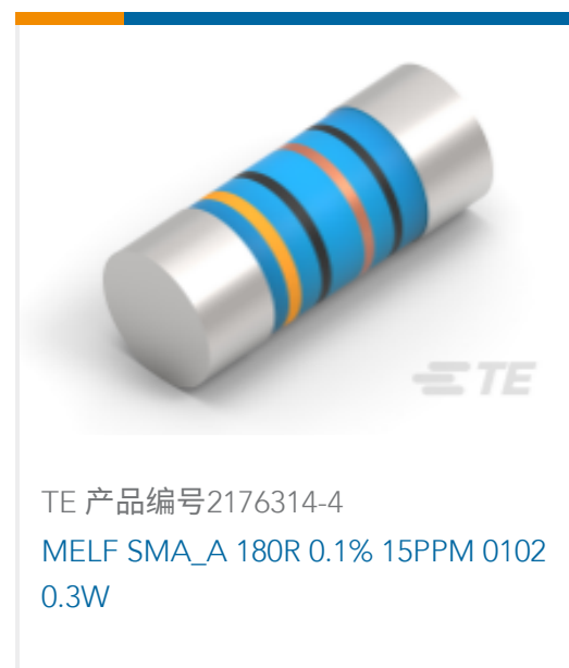
TE 产品编号2176314-4 MELF SMA_A 180R 0.1% 15PPM 0102 0.3W