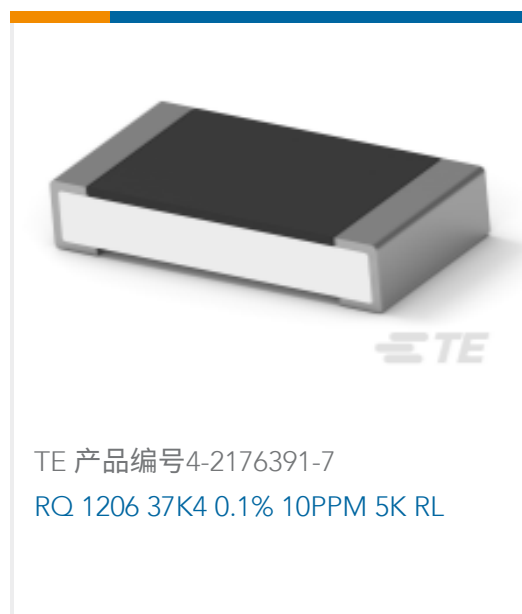
TE 产品编号4-2176391-7 RQ 1206 37K4 0.1% 10PPM 5K RL