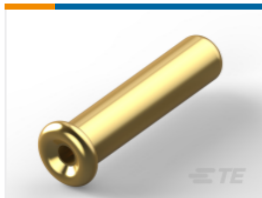
TE 产品编号 2-332095-2 SOCKET,MIN-SPR W/KO AU SER-1