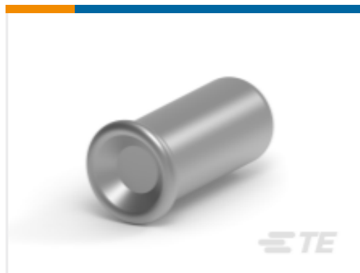
TE 产品编号 1-5331677-8 SOCKET,MIN-SPR SN-AU SER-3