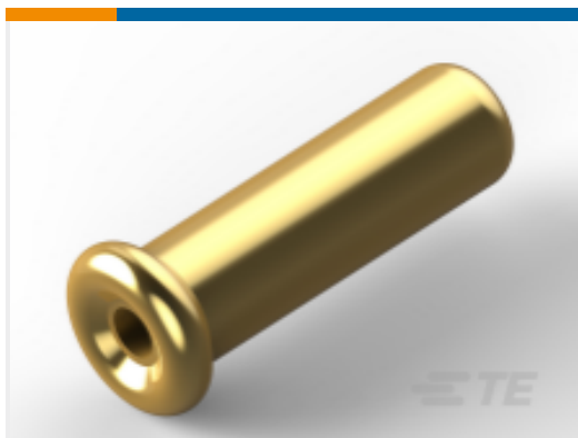
TE 产品编号 CAT-377-MSSCB3 迷你弹簧插座：末端闭合，3A