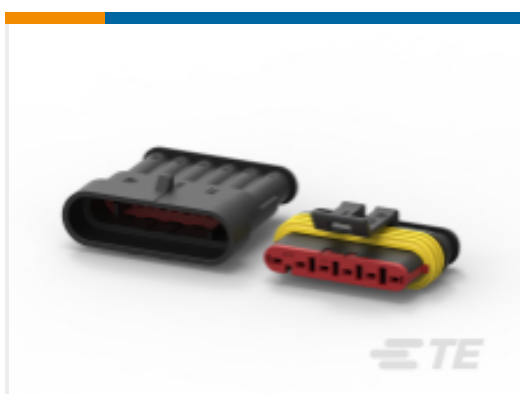
TE 产品编号282104-1 AMP SUPERSEAL 1.5MM，连接器壳体