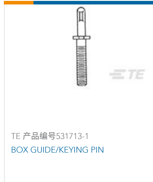
TE 产品编号531713-1 BOX GUIDE/KEYING PIN