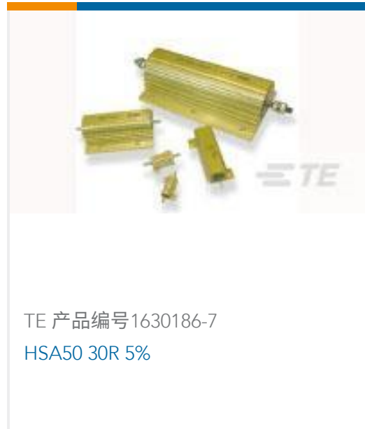
TE 产品编号1630186-7 HSA50 30R 5%