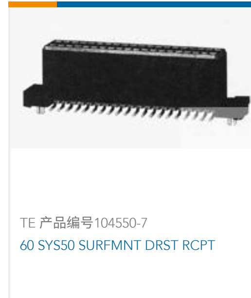
TE 产品编号104550-7 60 SYS50 SURFMNT DRST RCPT