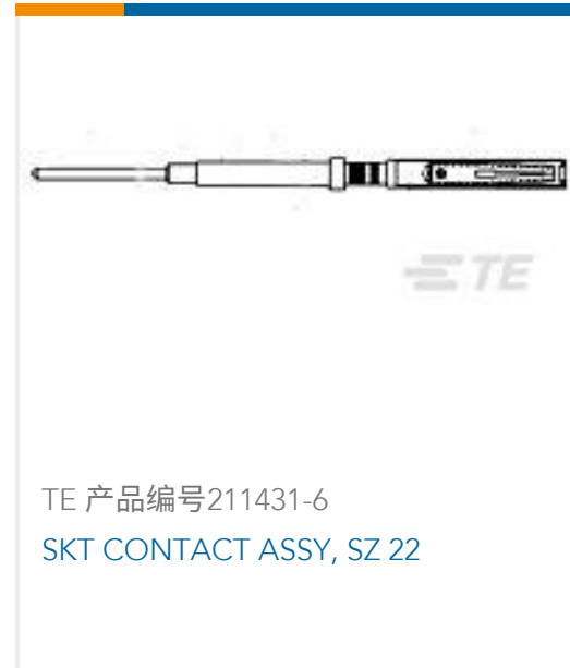
TE 产品编号211431-6 SKT CONTACT ASSY, SZ 22