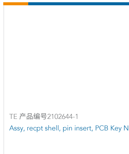
TE 产品编号2102644-1 Assy, recpt shell, pin insert, PCB Key N