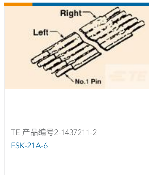
TE 产品编号2-1437211-2 FSK-21A-6