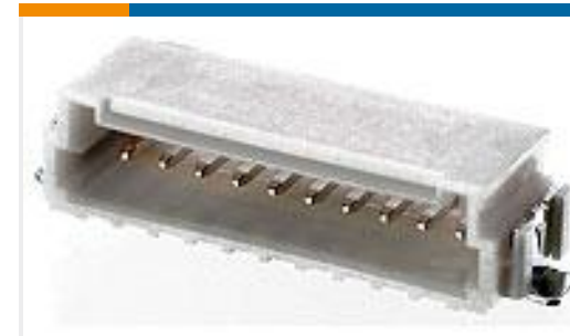
TE 产品编号1-292228-3 1.5 MINI CT SGL H SMT W/O BOSS