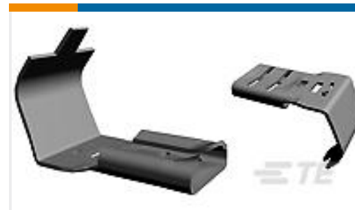
TE 产品编号62091-2 250 FLG FAST RCPT 18-12 PTPBR