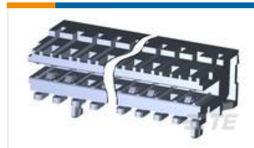
TE 产品编号4-1534798-7 AMP DUOPLUG MK2 CONNECTOR 7P SELECTIVE