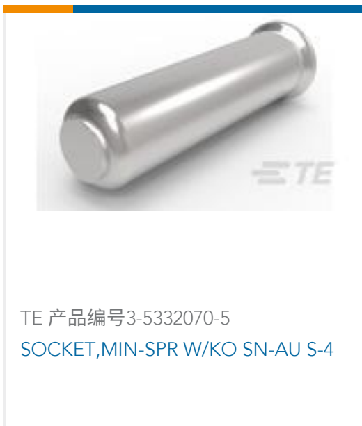
TE 产品编号3-5332070-5 SOCKET,MIN-SPR W/KO SN-AU S-4