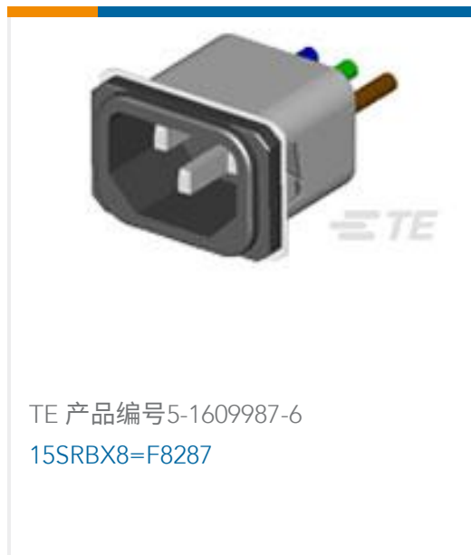
TE 产品编号5-1609987-6 15SRBX8=F8287