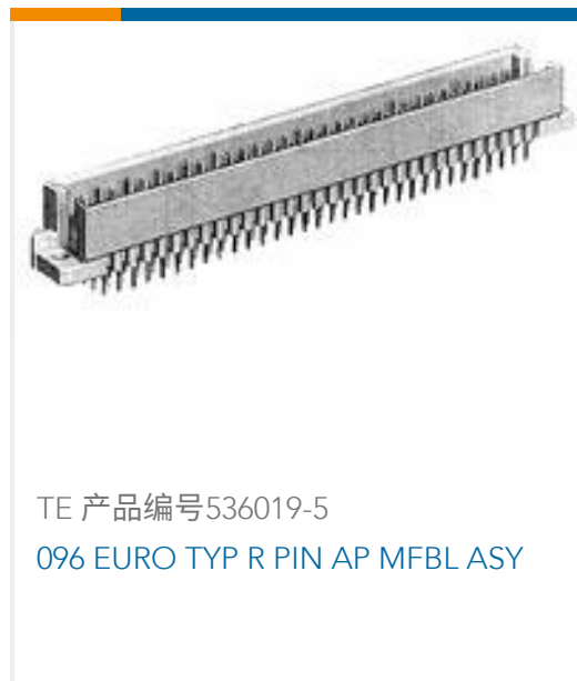
TE 产品编号536019-5 096 EURO TYP R PIN AP MFBL ASY