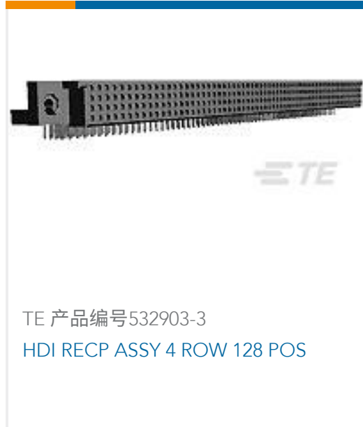
TE 产品编号532903-3 HDI RECP ASSY 4 ROW 128 POS