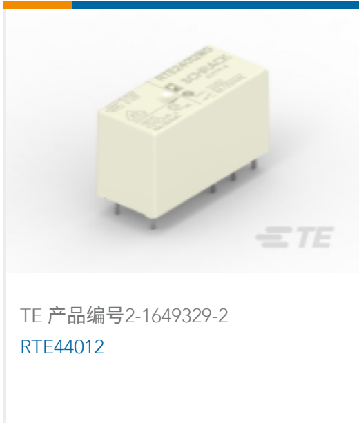
TE 产品编号2-1649329-2 RTE44012