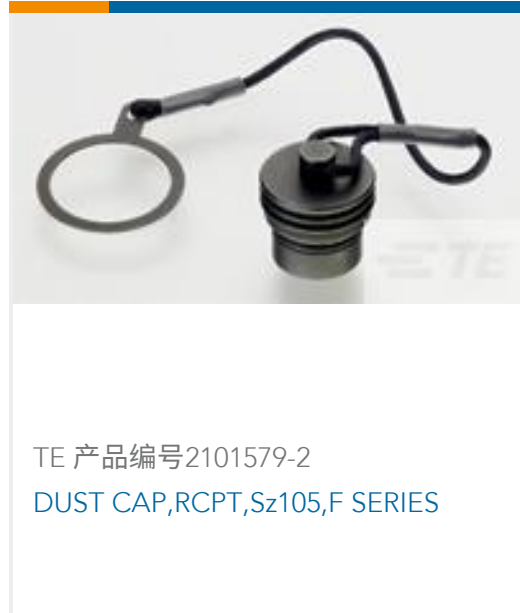
TE 产品编号2101579-2 DUST CAP,RCPT,Sz105,F SERIES