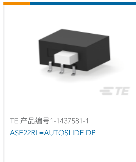
TE 产品编号1-1437581-1 ASE22RL=AUTOSLIDE DP