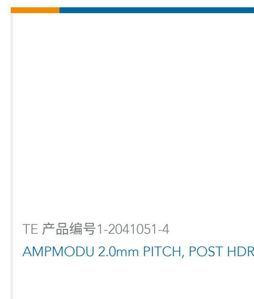
TE 产品编号1-2041051-4 AMPMODU 2.0mm PITCH, POST HDR