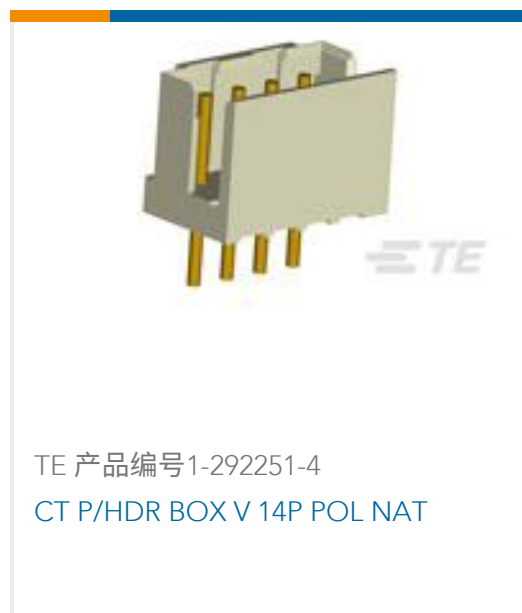
TE 产品编号1-292251-4 CT P/HDR BOX V 14P POL NAT