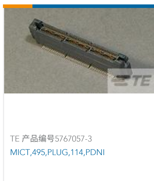
TE 产品编号5767057-3 MICT,495,PLUG,114,PDNI