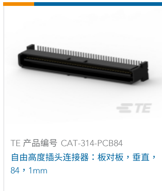
TE 产品编号 CAT-314-PCB84 自由高度插头连接器：板对板，垂直，84，1mm