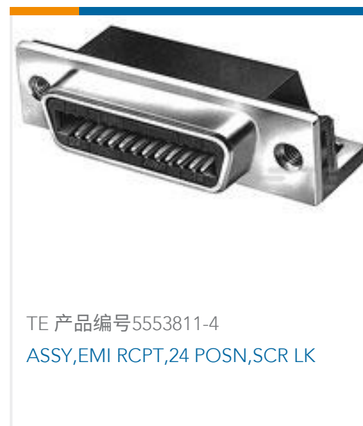
TE 产品编号5553811-4 ASSY,EMI RCPT,24 POSN,SCR LK