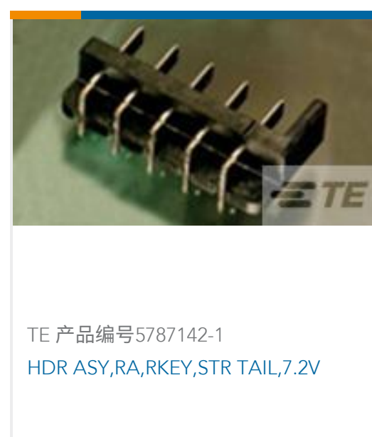
TE 产品编号5787142-1 HDR ASY,RA,RKEY,STR TAIL,7.2V