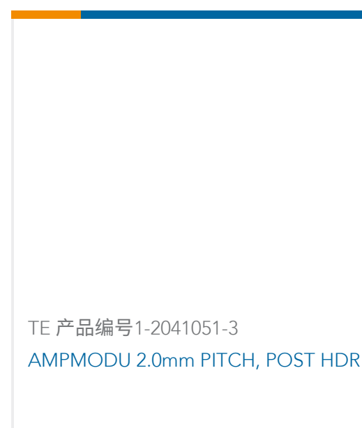
TE 产品编号1-2041051-3 AMPMODU 2.0mm PITCH, POST HDR