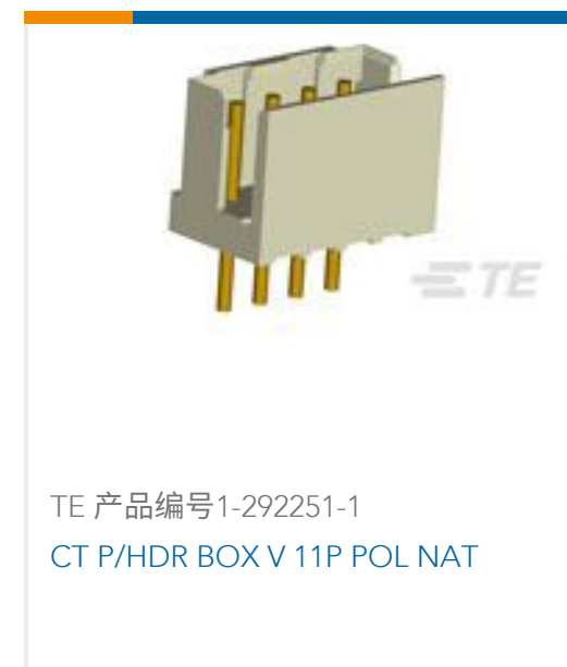
TE 产品编号1-292251-1 CT P/HDR BOX V 11P POL NAT