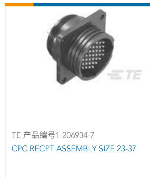
TE 产品编号1-206934-7 CPC RECPT ASSEMBLY SIZE 23-37